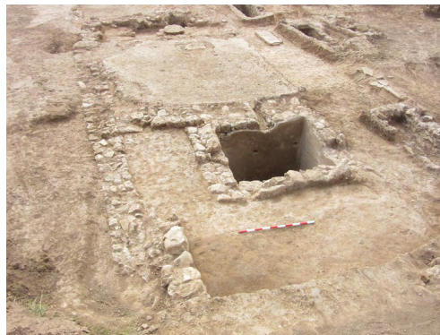
Figura 8. El torcularium d'època visigòtica.

Per una altra banda, i en un context constructiu i evolutiu similar al que tot just acabem de descriure per la zona meridional, cal fer referència a una àrea d'habitat, emmagatzematge i producció agrícola emplaçada darrere de les estances residencials de la villa i a migjorn del gran recinte productiu de la fase precedent. Aquesta,