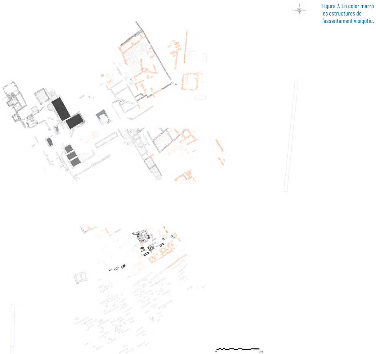
Figura 7. En color marró les estructures de l'assentament visigòtic.

premsatge. D'aquesta manera, i com és habitual en aquest tipus d'espais productius, les dues estances que conformen aquesta instal·lació presentaven distintes cotes de circulació, ja que d'aquesta manera s'assegurava un increment de la capacitat de premsatge i es millorava la seva maniobrabilitat gràcies a la disminució del recorregut vertical de la biga (Brun, 2003; Peña, 2010). Així, tal com succeeix en el torcularium dels Castelletes, l'estança situada a una cota més elevada topogràficament —anomenada zona de premsatge o d'extracció— estava pavimentada en opus signinum i era el lloc on se situava l' areae i l'encaix del cap del praelum , mentre que l'estança inferior —anomenada zona d'accionament— quedava reservada per a la ubicació del contrapès del torcus i, en aquest cas concret, per la ubicació d'un lacus de 2.500 litres de capacitat. En relació amb això, i malgrat la dificultat que comporta poder establir amb certesa quin era el producte transformat sense les anàliques convenients, pensem que l'absència de certes estructures característiques de les premses d'oli com podrien ser els dipòsits de decantació o les mola oliaria , porten a pensar més en una producció vitivinícola que oleica. En darrer terme, a l'est d'aquest conjunt, es localitzava un gran retall allargassat que, probablement, s'hauria d'haver creat en el marc de la utilització i funcionament del torcularium , però en desconeixem completament la seva funció durant aquest període (fig. 8).