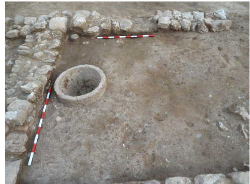
Figura 10. Imatge de l'àmbit amb el morter de pedra localitzat al seu interior.

En termes més generals i de context històric, l'aparició d'aquest tipus d'assentaments rurals d'època visigòtica al voltant de les restes d'una villa tardoromana precedent no és un fet aïllat ni desconegut. De fet, és una tònica que en molts casos esdevé un patró força comú com ha pogut demostrar l'arqueologia en els darrers anys. Aquestes noves ocupacions s'originen de forma desigual entre finals del segle V i principis del segle VI dC i, normalment, no es detecta una reocupació directa de les seves edificacions sinó que les noves àrees d'hàbitat i producció se situen al seu voltant. En aquest sentit, la morfologia d'aquests establiments evidencia una planificació i organització de les seves àrees funcionals, amb les zones de producció i treball ubicades perifèricament al voltant dels espais de residència i des d'un punt de vista productiu s'evidencia una base econòmica eminentment agropecuària centrada en la producció cerealista i vitivinícola, tal com s'ha pogut detectar força bé en la villa dels Castelletts. A banda d'això, també és freqüent localitzar les àrees