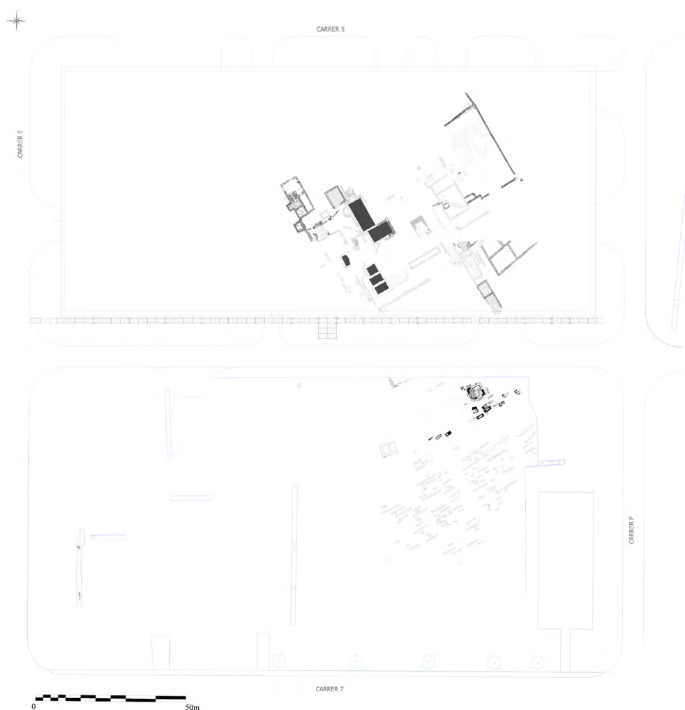
Figura 3. Plànol general de la villa baix imperial.

El següent gran període d'ocupació de la villa dels Castelletes cal situar-lo a partir d'inicis del segle V dC, moment en què seria objecte d'una reforma arquitectònica integral que li acabaria donant una nova fisonomia. L'àrea edificada d'aquest establiment formaria un conjunt compacte de planta quadrangular de 6800 m 2 de superfície i totes les seves construccions foren bastides amb murs encofrats d' opus caementicium . D'entrada, i si ens fixem en la distribució que mostren els nous sectors, s'evidencia amb certa claredat com aquests ocuparien una posició força similar a la que ja disposaven en la fase anterior, amb els espais residencials de l'emplaçament ubicats a la meitat occidental i els productius a la meitat oriental. (fig. 3) Certament, durant aquesta fase constructiva s'haurien anul·lat algunes de les instal·lacions del període precedent com podria ser la cella vinaria i el torcularium a què fèiem referència més amunt, mentre que altres haurien estat reedificades i adaptades a unes noves funcionalitats. Respecte a aquest últim fenomen, podríem fer esment a la reforma que es produeix sobre el conjunt termal alt imperial i que