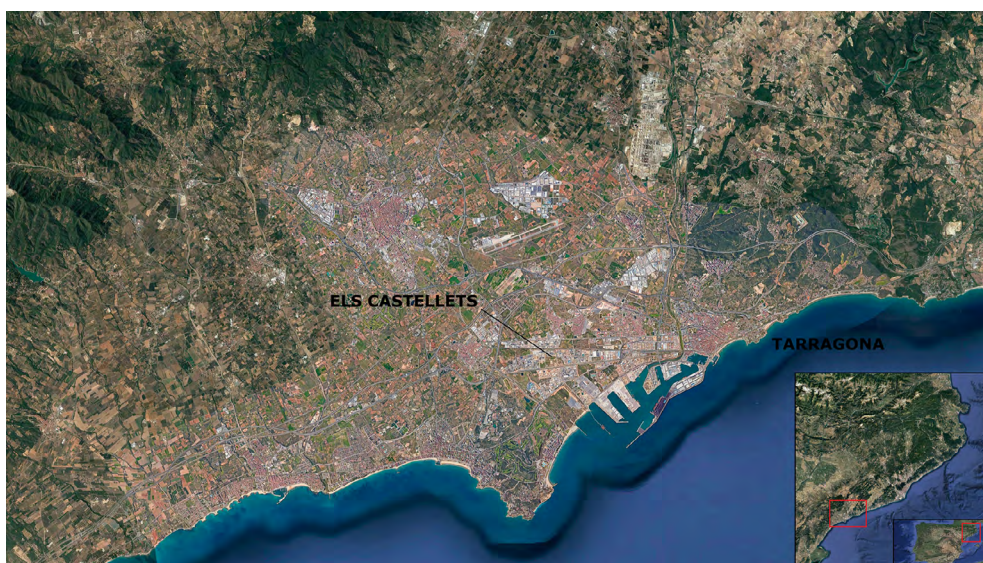
Figura 1. Ubicació del jaciment.

Les restes de la villa dels Castelletes estan situades en el terme municipal de La Canonja, una petita població emplaçada a l'oest de la ciutat de Tarragona i que en l'actualitat concentra la gran majoria d'empreses petroquímiques de la zona (fig. 1). Precisament, les distintes intervencions arqueològiques realitzades en el jaciment es deriven de l'ampliació d'aquesta àrea industrial amb la construcció de dues noves plantes per part de Kemira Ibéricos S.A. i Covestro S.L. al Polígon Industrial Entrevies. Els treballs d'excavació, que foren executats per dues empreses d'arqueologia diferents, i dirigits per diversos d'arqueòlegs vinculats al món