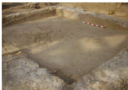
Figura 5. Un dels àmbits residencials de la villa baix imperial.

Tot i que no s'ha pogut reconèixer en la seva veritable dimensió, a causa del fort arrasament al qual hauria estat sotmesa, la pars rustica de la nova hisenda es trobaria emplaçada a la meitat oriental del conjunt, entorn de les construccions productives de l'establiment precedent en part ja amortitzades en aquest període d'ocupació. Aquí, a continuació de l'antic torcularium i per sobre de l'antiga cella