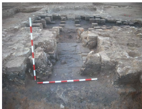
Figura 4. El prae-furnium del balneum baix imperial.