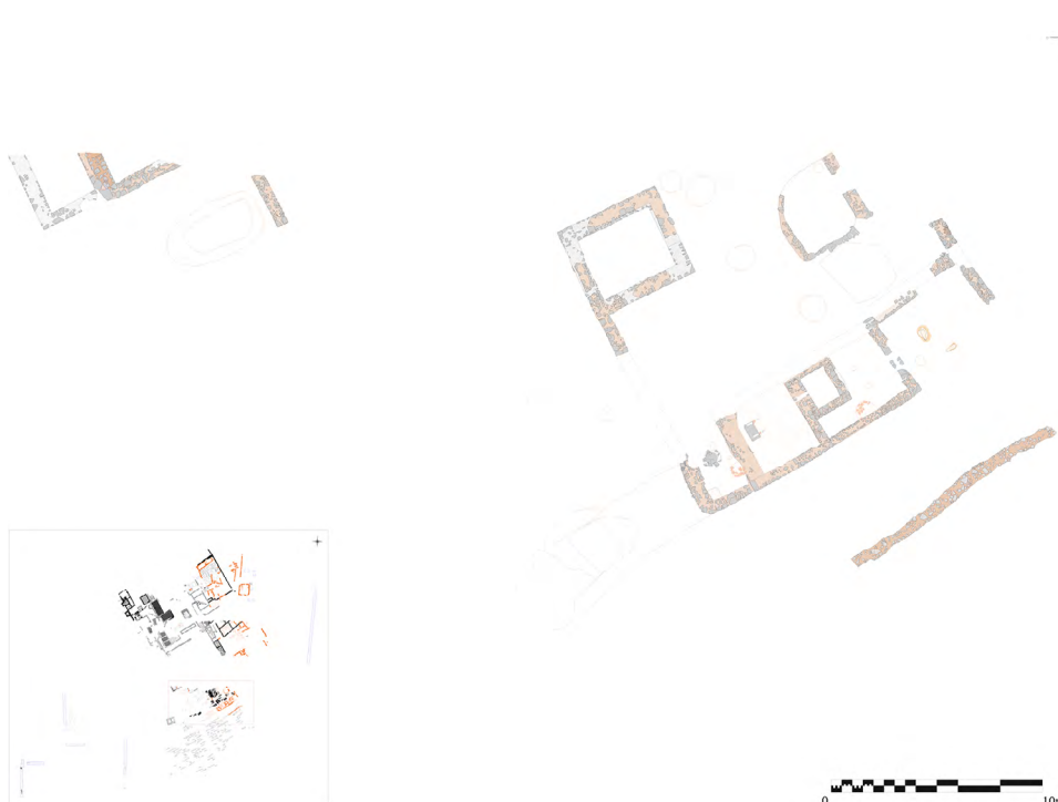
Figura 9. L'àrea meridional de l'assentament en època visigòtica tardana.