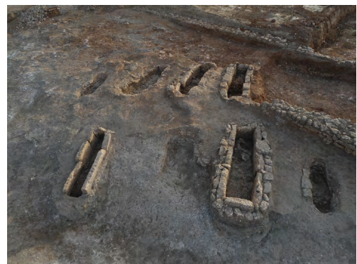
Figura 11. Àrea funerària de l'assentament visigòtic.