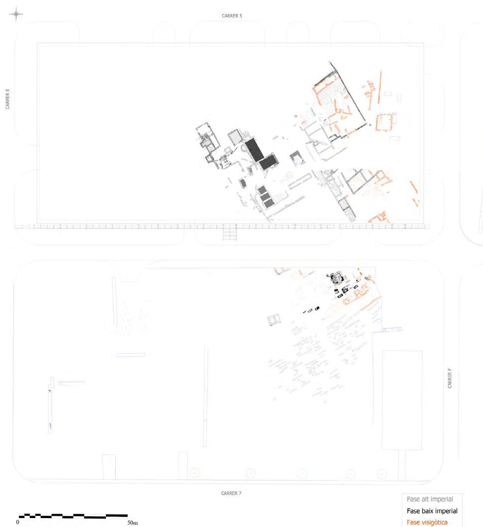
Figura 2. Plànol general de la villa amb distinció cromàtica de les seves fases.

professional, s'alternaren entre els anys 2012 i 2018. 4 En bona part, aquest context preventiu en el qual es va haver d'actuar havia provocat una certa disseminació de les dades arqueològiques disponibles que no havia afavorit gaire ni a l'estudi ni a la difusió d'una de les villae més interessants i ben reconegudes de l'entorn de Tarragona, amb més d'una hectàrea de superfície i una seqüència d'ocupació que abasta des de l'alt imperi romà fins a l'alta edat mitjana. 5 (fig. 2) Respecte a això, i si bé és cert que es va poder intervenir sobre una gran superfície que pràcticament va permetre definir la totalitat de l'emplaçament, algunes zones encara resten inexplorades en el subsol d'aquest complex petroquímic, mentre que altres no es van poder acabar d'esgotar estratigràficament perquè no van quedar afectades pels projectes d'obra que propiciaren aquestes campanyes d'excavació. Finalment, voldríem assenyalar que la dinàmica constructiva desenvolupada en els darrers segles al voltant d'aquesta àrea arqueològica ha comportat la seva destrucció en menor o major grau, amb la pèrdua d'informació estratigràfica que això comporta en molts casos. D'aquesta manera, les estructures millor preservades eren totes aquelles que