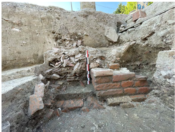
Figura 6. S. Venanzio 3, i resti del muro del terzo edificio ecclesiastico.