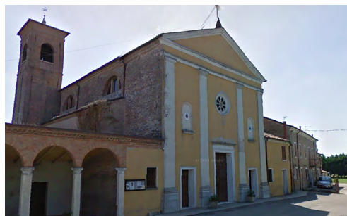
Figura 7. Coccanile, l'attuale chiesa di S. Venanzio (S. Venanzio 4).

La chiesa era ancora in costruzione nel 1613 dopo che la precedente, secondo quanto ci riporta una visita pastorale del 1571, era collabente. Purtroppo non si hanno notizie del momento della fondazione di questa precedente chiesa, mancando sia fonti specifiche che indagini archeologiche mirate. E' stato certamente un avvenimento molto importante perché per la prima volta la chiesa si venne a trovare sul lato destro, anziché sinistro, del canale Naviglio. Evidentemente però il ricordo dell'esistenza delle precedenti chiese rimaneva saldamente ancorato al territorio. Ciò è provato non solo dalla persistenza dell'agiotponimo ma anche dalla tradizionale processione religiosa che, partendo dall'attuale chiesa terminava il suo percorso proprio in Via Ariosto, lungo le sponde del Canale Naviglio, nel medesimo luogo dove sono stati individuati i resti degli edifici denominati S. Venanzio 1 e S. Venanzio 3.