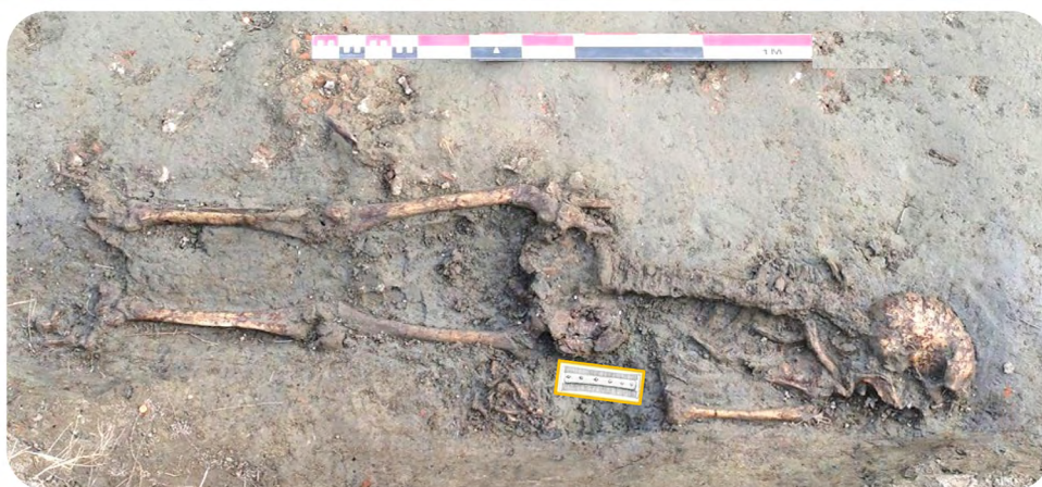
Figura 3. S. Venanzio 1, tomba 2 con evidenziazione del pettine in osso