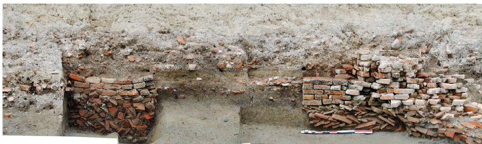
Figura 4. S. Venanzio 1, sezione della sponda del canale: sono evidenti i resti dell'abside a destra e la base del primo pilastro della chiesa a sinistra.

rinvengono alcuni denti di equino. La loro posizione non è chiara dal momento che l'inumazione appare sconvolta da precedenti lavorazioni ma non è da escludere che facessero parte di un'offerta rituale; ossa animali all'interno di tombe come queste si ritrovano anche in alcune sepolture di Santa Maria in Padovetere, poco a sud ovest di Comacchio (Balista, Berti, 2017).