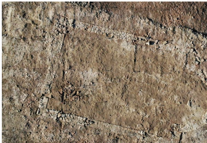
Figura 5. S. Venanzio 2, vista dall'alto del cantiere di scavo.

L'area oggetto della segnalazione del rinvenimento di alcuni materiali era ancora occupata dalle coltivazioni, per cui si è deciso di effettuare una serie di sorvoli con un drone che hanno permesso di individuare un cropmark che non lasciava dubbi. L'immagine in RGB evidenzia infatti il perimetro completo di un edificio absidato, lungo circa 11 × 6,5 m, orientato est-ovest. Subito dopo il raccolto quindi si inizia una campagna di indagine estensiva su di un'area di 275 mq. Immediatamente al di sotto dell'arativo, a circa -0,50 m dal piano di campagna, sono comparsi i resti delle fondazioni di un secondo edificio