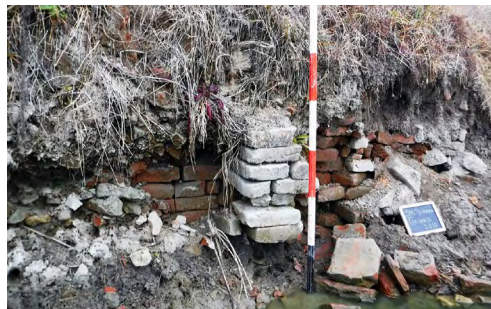
Figura 2. I resti di S. Venanzio 1 che affioravano dallo sponda del canale.