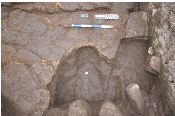
Figura 5. Estructura antropomorfa documentada en el yacimiento de A Capela.

parte oriental de la sepultura (fig. 5). Cubría el corte un depósito de piedras de tamaño medio y cascajo, en el que se documentaron algunas cerámicas de pasta gris con incisiones (zigzags y línea curva). Estas decoraciones aparecen representadas con frecuencia entre las diferentes tipologías cerámicas. En Galicia, algunos motivos similares se localizaron, por ejemplo, en Cova Eirós, donde las dataciones radiocarbónicas de los contextos estratigráficos asociados han proporcionado fechas entre los siglos X y XI d. C. (Vila, de Lombera, Fábregas y Rodríguez-Álvarez, 2018, p. 99).