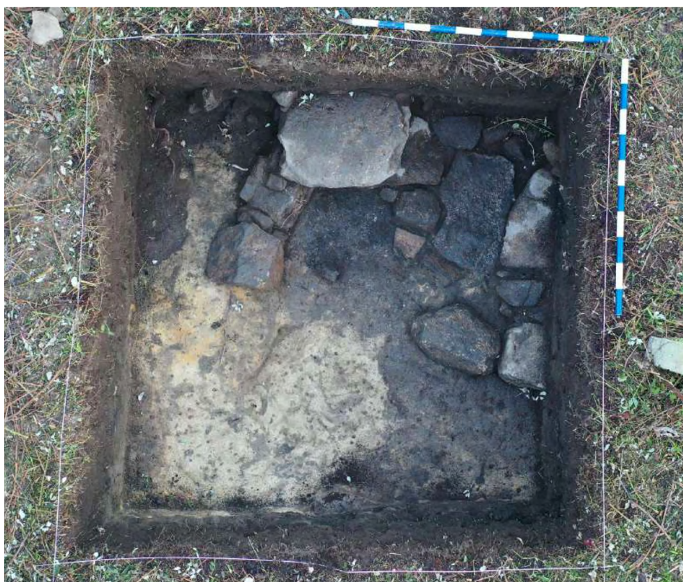
Figura 8. Vista de la estructura documentada en el sondeo 4, una vez localizado el sustrato geológico.