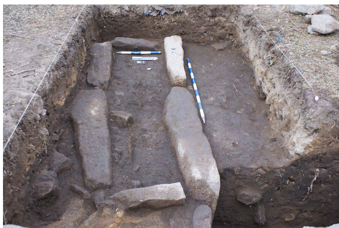
Figura 4. Sepultura de lajas de granito exhumada en el sondeo 1.

El sondeo 2, se situó en la parte este de la parcela (fig. 8), y contó con unas dimensiones de 6,28 m 2 . La secuencia estratigráfica en esta cata estaba menos alterada que en el sondeo 1. Bajo la cubierta vegetal se localizó un sedimento orgánico de entre 20 y 40 cm, que cubría el afloramiento rocoso granítico. Durante la limpieza del sustrato, se documentó, parcialmente, el corte de una sepultura antropomorfa, sin restos óseos. Su orientación era, como en la cata 1, E-O, con el rebaje correspondiente a la cabeza, ubicado en la