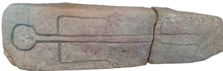
Figura 3. Lauda sepulcral documentada en el año 1966 en la finca de «A Capela».

La superficie excavada ascendió a 24 m 2 , distribuida entre cuatro sondeos manuales (fig. 8). Puesto que la parcela presenta un notable desnivel entre su parte norte y su parte sur, se plantearon 3 sondeos en la primera y uno en la segunda. Además, se limpió un corte en la parte noroeste de la parcela, en el cual los vecinos aseguraban que se había extraído, en el año 2004, una lauda antropomorfa de una sepultura infantil (fig. 3). Dicha lauda, elaborada en granito, se conserva actualmente en el Museo de Pontevedra, y cuenta con unas dimensiones de 1,40 m x 0,43 m.