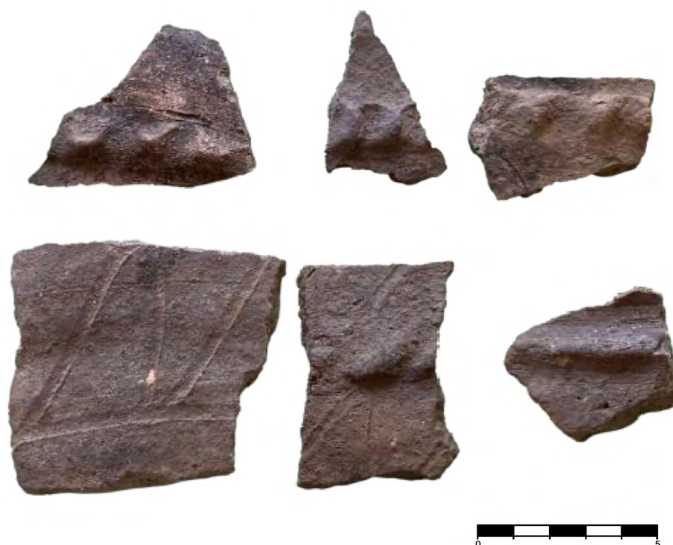
Figura 7. Fragmentos de cerámicas grises recuperados durante la excavación del sondeo 4 (elaboración propia).

Además de tratarse del sondeo con mayor presencia de restos materiales (en total, 315 números de inventario, incluyendo tejas curvas, cerámica gris, restos líticos y un elemento metálico), por debajo del nivel arqueológicamente fértil se documentó una estructura configurada con un murete perimetral y una base plana configurada con losas. Sus dimensiones (1,22 m de largo x 0,86 m de ancho) están incompletas, puesto que la estructura se extiende bajo la superficie no excavada (fig. 8). En cuanto a su interpretación, la ausencia de restos relacionados directamente con la estructura dificulta su comprensión, si bien, teniendo en cuenta las evidencias documentadas en el yacimiento, y su propia tipología, puede avanzarse que podría tratarse de una estructura funeraria de base pétrea, que contaba con un muro perimetral y estaba tapada con lasjas. Dadas sus dimensiones, es posible que se tratase de un enterramiento de carácter colectivo, sobre el cual no pueden establecerse precisiones cronológicas con la información disponible, puesto que no se localizaron materiales asociados directamente con esta estructura, que se apoya directamente sobre un depósito natural de granito meteorizado.