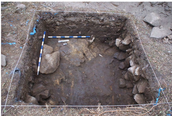
Figura 6. Foto final del sondeo 3, desde el este. La excavación se detuvo al documentar restos de dos inhumaciones (fotografía: Diego Piay).

En esta cata se documentó, una vez retirada la cubierta vegetal y el nivel de tierra orgánica, un depósito fértil, sin intrusiones, en el que se localizaron numerosos fragmentos cerámicos de pasta gris (fig. 8), muchos de ellos con decoración incisa (acanaladuras, líneas oblicuas y en zigzag), y otros con decoración plástica (cordones y mamelones), que encuentran, en Galicia, paralelos en el yacimiento de As Pereiras (siglos VIII-XI) y en el castillo de Portomeiro, en el cual se datan en el siglo X decoraciones con cordones digitales, además de piezas con incisiones cortas y oblicuas (Alonso, 2021, pp. 779-781).