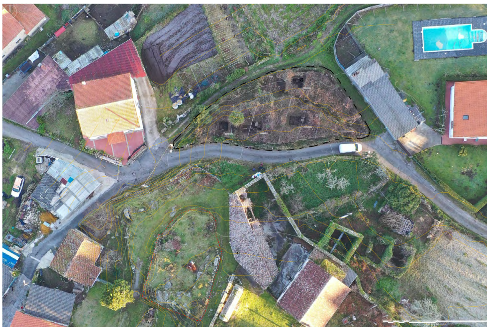
Figura 10. Vista cenital del yacimiento de A Capela tras finalizar la intervención arqueológica. Abajo, a la izquierda, restos de una estructura conservada en la aldea de San Salvador.

suroeste de la finca (fig. 10). Esa zona no ha sido objeto de una actuación que permita ratificar o desechar dicha tesis.