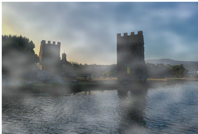
Figura 1. Vista actual de las Torres de Oeste, desde el río Ulla.

Dicho yacimiento oculta, no obstante, una riqueza mucho mayor, debida a la presencia de ocupaciones anteriores que encuentran su justificación en la privilegiada situación de este enclave (Naveiro, 1990; 1992; 2002). Se encuentra en la parte más estrecha del río, en una vía de penetración natural hacia el interior de Galicia (fig. 2). Eso explica que en las actuaciones arqueológicas desarrolladas en el yacimiento en los años 1950-1951 (Chamoso, 1951), 1970-1973 (Balil, 1970; 1977), 1989 (Naveiro, 2004) y 2011, (Hervés, 2011), se haya documentado una prolongada ocupación del solar en el cual hoy se alzan las Torres de Oeste, que se remonta a la Edad del Hierro (Piay y Naveiro, 2023, pp. 73-83). Al asentamiento prehistórico siguió uno de época romana, que debe interpretarse como un establecimiento portuario de cierta importancia, canalizador de las mercancías dentro del importante nudo de comunicaciones que constituye el área de Iria Flavia (Naveiro, 2004, p. 122). Los restos cerámicos apuntan a