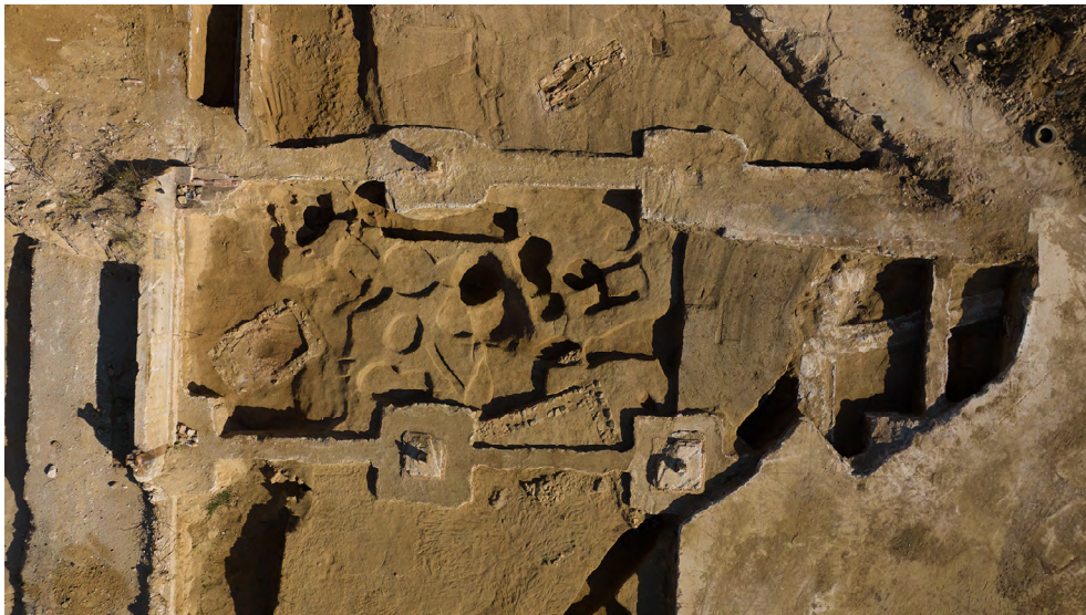
Figura 4. Vista del torcularium .

dues reparacions posteriors; en tots tres paviments presentava una cubeta per recollir les impureses i facilitar el seu buidatge (fig. 4).