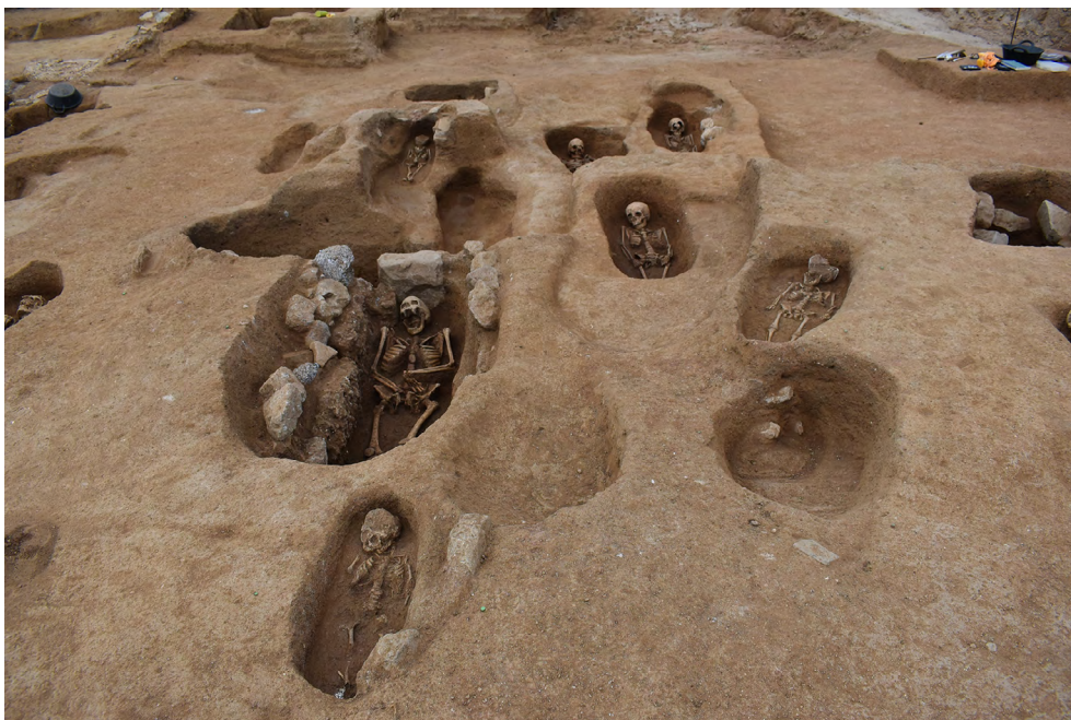
Figura 7. Vista del conjunt d'UF.

un total de 106 individus. A banda dels 200 individus, segons fonts orals, destruïts sense control amb la construcció de la fàbrica el 1972 (fig. 7).