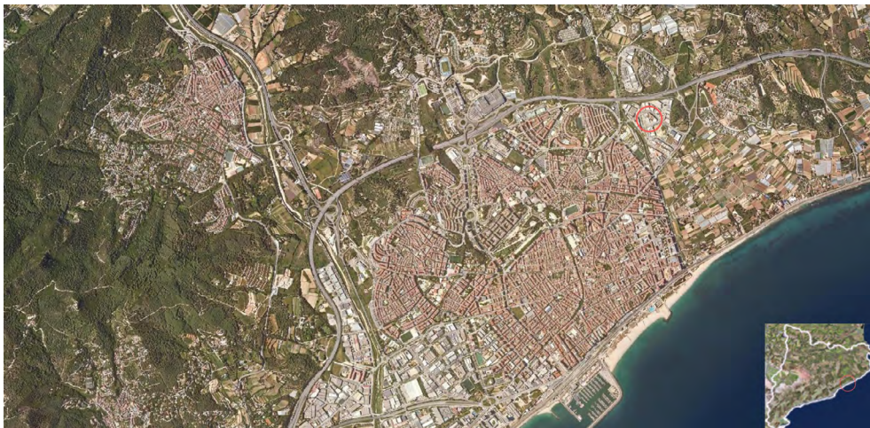
Figura 1. Plànol de Mataró amb la situació del jaciment respecte del centre històric.

El jaciment de Ca la Madrona se situa dintre del terme municipal de Mataró, a 1,3 km al nord del seu centre històric, en l'actual polígon de Mataró-Rocafonda. Ha estat excavat durant els treballs d'eliminació de l'antiga fàbrica de les Cristalleries Mataró, com a pas previ a la construcció del futur Parc Circular Mataró – Maresme, propietat del Consorci per al Tractament de Residus Sòlids Urbans del Maresme (fig. 1).