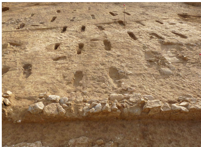
Figura 10. Conjunt de rases de vinya amb el mur de marge en primer terme.

La segona de les vinyes estava delimitada pel cantó oest per un mur que faria de marge del camp. Es conservaven 19,50 m en tres parts, però la seva trinxera d'espòli continuava més enllà. Estava fet amb pedres petites, mitjanes i material constructiu romà lligats amb fang. En total es van localitzar trenta-vuit rases, disposades a l'est del mur, organitzades en vuit columnes amb una distància entre columnes al voltant dels 0,80 m i de 0,85/0,90 m entre rases de la mateixa columna (fig. 10).