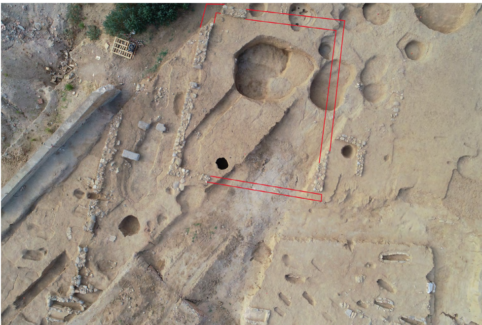
Figura 6. Vista de l'Aula i el camí amb la necròpolis a l'est i al nord-oest.

El camí estava delimitat a l'altra banda per un mur fet amb la mateixa tècnica que la de l'edifici. Es van excavar diversos nivells de circulació i reparacions del mateix camí. Aquest va patir diverses erosions en la seva part central, que es reomplien per tal de deixar una superfície plana. També es van localitzar tres pedres que podrien servir per passar d'un cantó a l'altre (fig. 6).