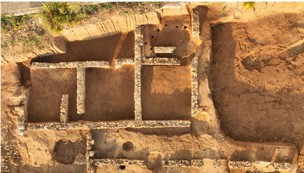
Figura 5. Vista de l'edifici situat a l'est.

Aquests murs i fonamentacions estaven fets de maçoneria, amb pedres sense treballar lligades amb una barreja de fang amb boles de morter de calç. No tenien molta alçada conservada, 0,63 m de màxima, i la major part corresponia a la fonamentació, que no es diferenciava estructuralment de la part visible. Tan sols teníem un possible nivell de circulació en cadascun dels àmbits, compost per argiles molt compactes que es lliuren als murs. Per sobre d'elles ja es disposaven els estrats d'obliteració de l'edifici. Totes aquestes dades ens fan pensar que estem davant d'un edifici pensat per executar tasques de caràcter productiu que no han deixat cap empremta, o bé destinat a l'emmagatzematge. Si mirem les seves mides exteriors, tenim 14,22 m de longitud per una amplada que desdoblant la bateria coneguda ens donaria 10,43 m, que en peus romans serien de 49 per 36 (fig. 5).