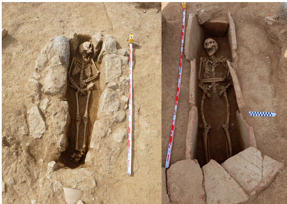
Figura 8. Vista de detall de les UF 17 a l'esquerra, i UF 33 a la dreta.

D'altra banda, només tenim un indicatiu de cristianisme en una de les tombes —de nou en una excavada l'any 1972—, on una de les tegulae de la coberta tenia incisa una creu dins un cercle.