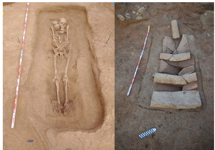
Figura 3. Vistes de la UF 51.

En molt poc temps veiem com per sobre de la necròpolis es disposa un camp de vinyes, localitzant diversos alveus per a plantar-hi ceps. Cap al 70 dC, es construirà un torcularium en aquest sector inferior. Només es va poder documentar part de la cella vinaria , on teníem diversos encaixos de dolia . Cap d'elles es va conservar in situ , a més a més, aquests encaixos es retallaven els uns als altres, fruit de la seva extracció per ser reparades. També es va observar l'encaix d'un contrapès, del tipus arca lapidum (Martín, 2012), amb unes mides d'1,40 per 1,5 m de longitud interna, i una alçada conservada de 0,46 m. Fruit dels espolis només es van localitzar, en la cara oest, dues de les pedres on es recolzava el contrapès quan no s'utilitzava. En últim lloc, també es va localitzar un lacus , amb unes mides internes de 2,08 per 1,20 m, amb una alçada conservada de 0,28 m. Aquest tenia el paviment originari i