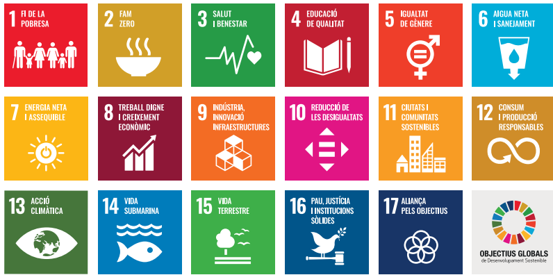
Figura 2. Els objectius pel desenvolupament Sostenible, amb la infografia original de l'ONU