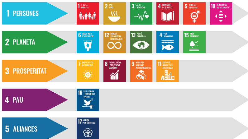
Figura 3. Classificació dels ODS. Els cinc eixos dels Objectius de desenvolupament sostenible

Les Nacions Unides categoritzen els 17 ODS en 5 grans eixos, són els «5 P» (persones, planeta, prosperitat, pau i partnership), i es troben representats a la següent figura: